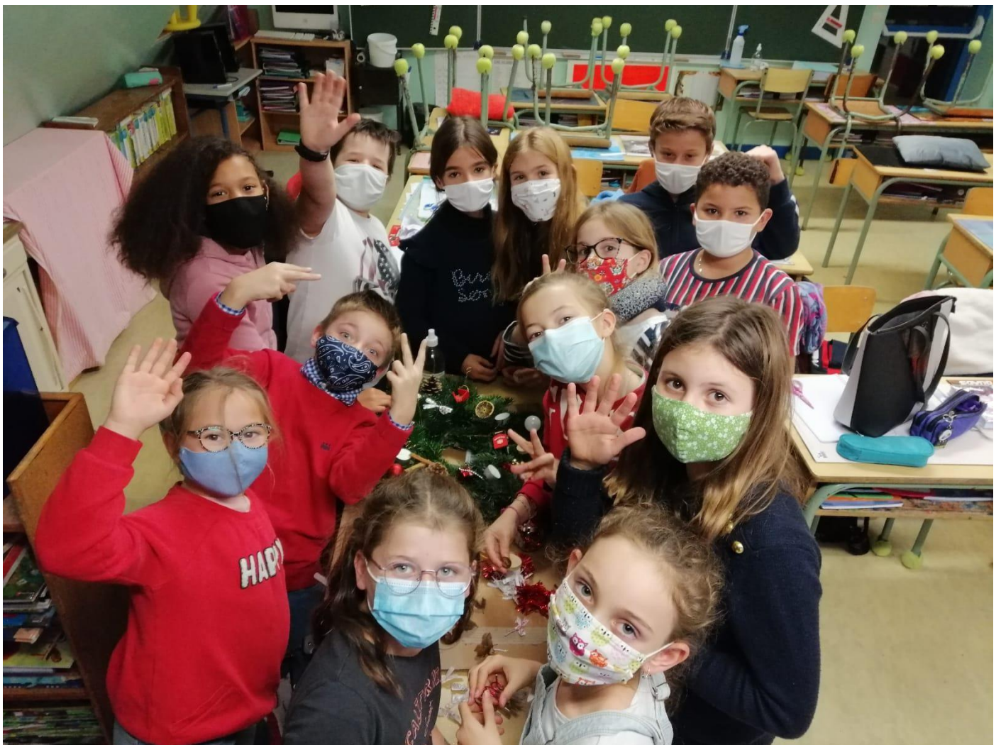
Fabrication de la crèche