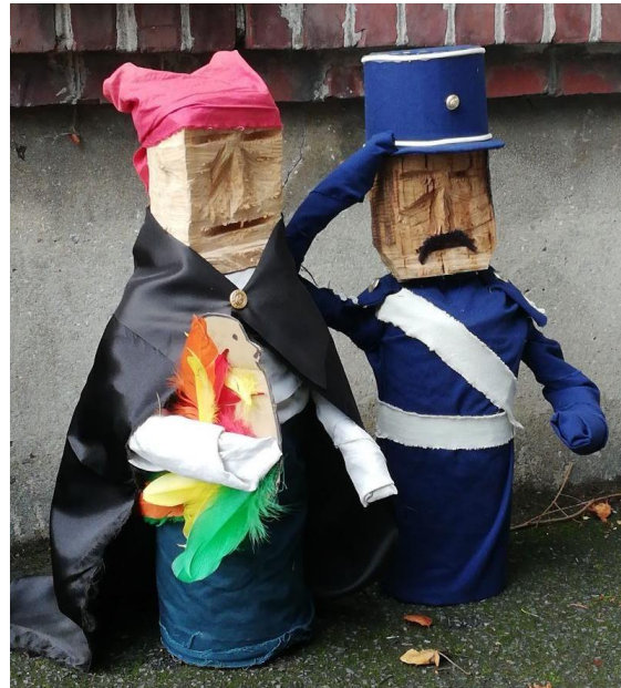
Le Boumian et le Gendarme