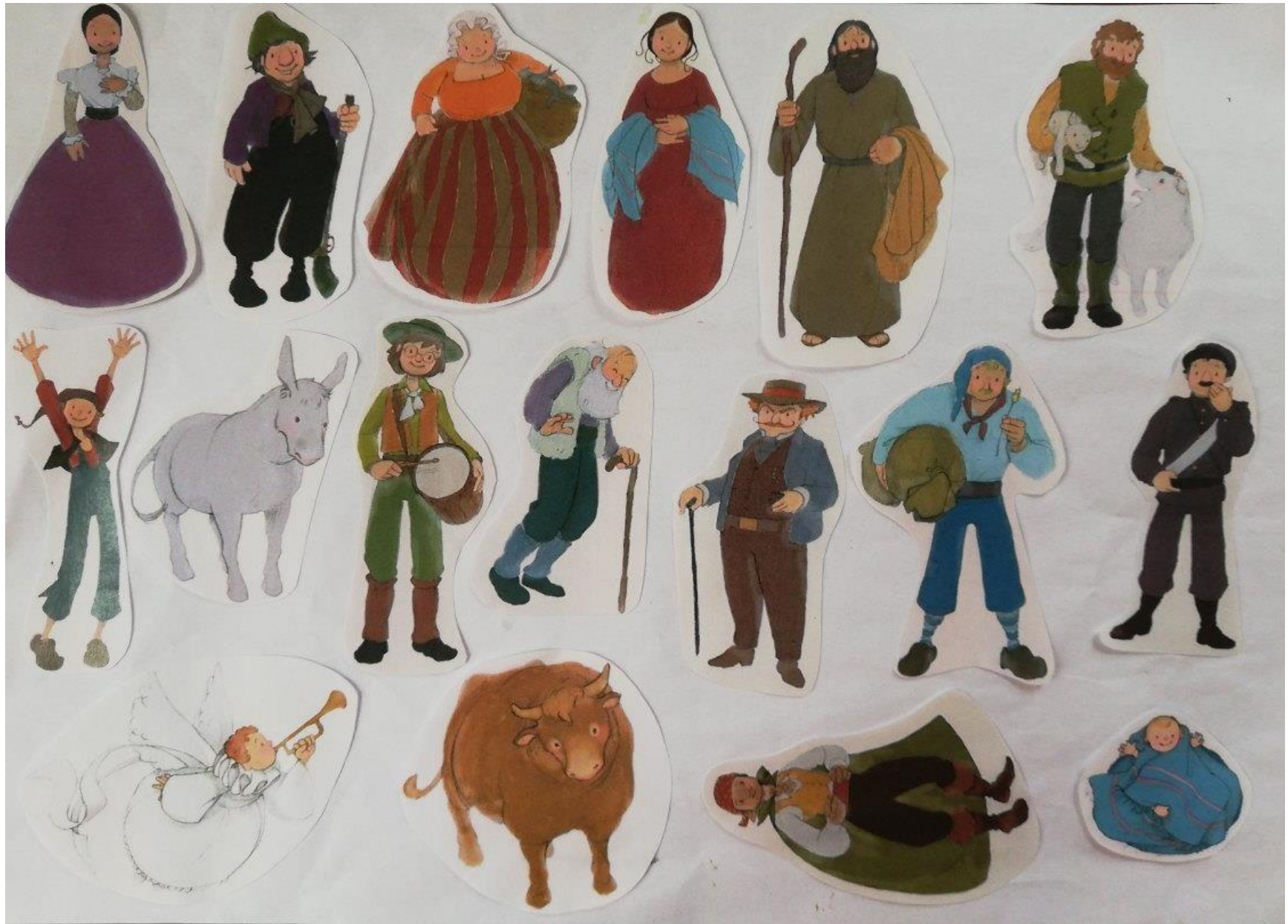
(les personnages ont été découpés et remis dans une enveloppe pour la crèche des classes)