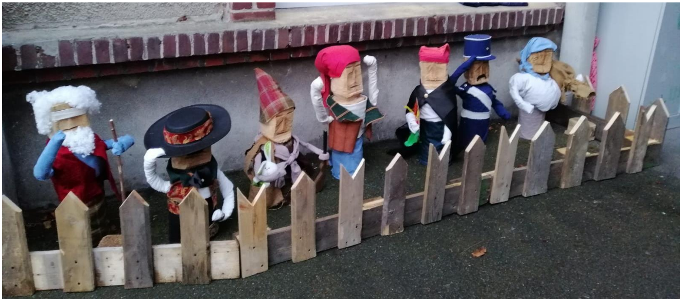
Présentation du conte dans les classes